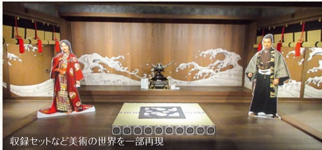
収録セットなど美術の世界を一部再現