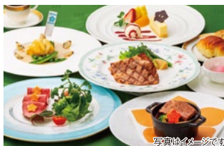
写真イメージです

和洋中3つのレストランのおすすめは、お1人様3,960円の「光秀ランチ」。料理内に桔梗紋等が隠れています。フランス料理は3品の飛騨牛料理が入って大変お値打ちです。