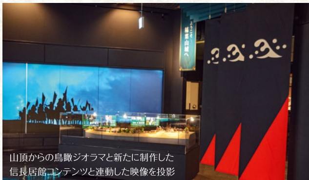
山頂からの鳥瞰ジオラマと新たに制作した信長居館コンテンツと連動した映像を投影