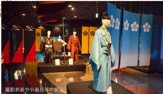
撮影衣装や小道具等の展示

2020年1月11日(土)より、岐阜県内3ヵ所(岐阜市・可児市・恵那市)に大河ドラマセットなどが展示され、大河ドラマの世界観を楽しむことができます。近くのお店で