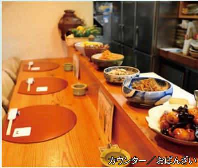
カウンター/おばんざい