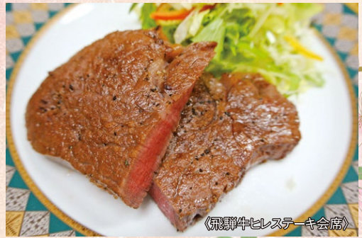
〈和牛ヒレステーキ会席〉

京料理をベースに「美味しいものを手作りする」「和食の基本を大切に独自の味を取り入れる」ことを大切に、来て頂いたお客様に満足してもらえる店作りをしております。