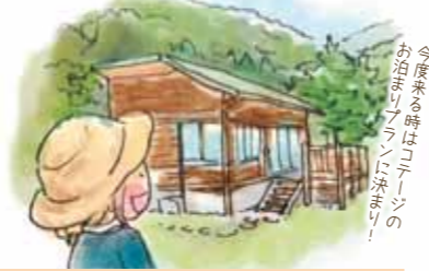
今度来る時は「カーテン」のお泊まりランチに挑戦！

緑豊かな自然と触れあえる体験型アウトドア施設。農業体験など通常体験に加え、夏休みは期間限定の体験メニューも豊富。「魚のつかみ取り(要予約)」は、1区画に放流したマスを素手でキャッチ。浅瀬をジャブジャブしながら、みんな夢中で魚を追いかけています。