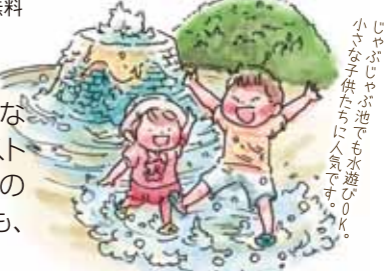
小さなお子様も安心して遊べます。

「水と緑と太陽」をテーマにした公園で、都市部にありながら季節の花やサイクリングなどが楽しめます。ミストが吹き上がる「大噴水」は、涼を求める人たちの憩いの場。清涼感たっぷりです。噴水をぐるりと囲む水路でも、みんな足を濡らして大はしゃぎしています。