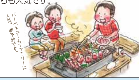
バーベキューファミリーに人気！要予約です。

自然の地形を活かした森の公園。散策やバーベキュー、遊具など遊びが盛りだくさん。夏、子どもたちで賑わうのが、「水のカーテン」。滝のような水の流れの裏をくぐり抜ければ、ひんやり涼しい気分。「あじさい池」にはアスレチック風のいかだがあり、こちらでも人気です。