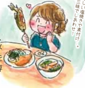
香ばしい塩焼きや煮付け、お魚三昧でしあわせ！

長良川の支流、板取川河畔に設けられた観光ヤナで、香ばしい塩焼きや煮付け、刺身、雑炊など多彩な鮎メニューに舌鼓。食事のあとは、ヤナ場へ上がって清流を楽しむこともできます。また、小学6年生以下限定で、専用の池に放たれた魚のつかみ取りも実施しています。