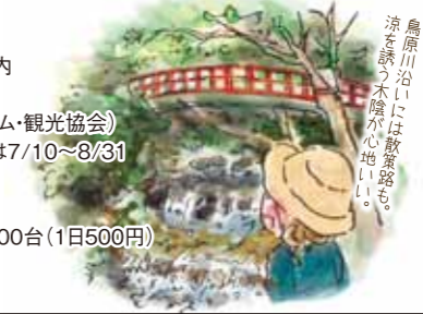
鳥原川沿いには散策路も。涼を誘う木陰が心地いい！

所 愛知県瀬戸市岩屋町28 0561-85-2730 (瀬戸市まるっとミュージアム・観光協会) 開 入園自由 ※天然プールは7/10~8/31 休 なし P 180台(無料) ※夏季は80台(無料)、100台(1日500円) Y 無料