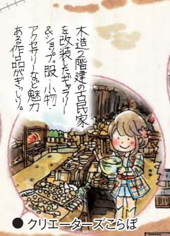
クリエイターズこらぼ