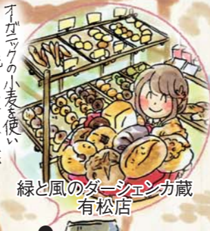
緑と風のダーシェンカ蔵 有松店