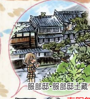
服部邸・服部邸土蔵