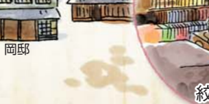
有松・鳴海校会館